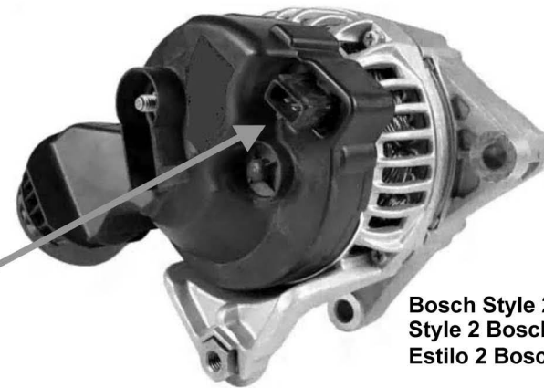
Bosch Style 2 Style 2 Bosch Estilo 2 Bosch

2) CLEAN VEHICLE AIR DUCTING!! This alternator's internal parts are cooled by fresh air that is transmitted by a system of air ducting on the vehicle. These ducts frequently become clogged with leaves or other debris. Be sure the ENTIRE air path has been cleaned prior to installing your replacement alternator!