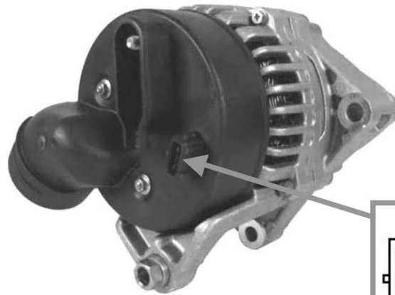
Bosch Style 1 Style 1 Bosch Estilo 1 Bosch

1) Different Appearance. The replacement alternator you've just purchased meets or exceeds the original manufacturer's specifications for correct vehicle performance. The vehicle manufacturers used a number of different suppliers for alternators on this vehicle. The units shown below are samples of the different designs which were used. The product we supply is of original equipment design and will replace any one of them.