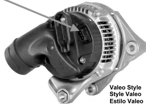
Valeo Style Style Valeo Estilo Valeo

2) CLEAN VEHICLE AIR DUCTING!! This alternator's internal parts are cooled by fresh air that is transmitted by a system of air ducting on the vehicle. These ducts frequently become clogged with leaves or other debris. Be sure the ENTIRE air path has been cleaned prior to installing your replacement alternator!